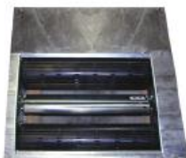
Jarrudynamometri (4 x 4 vakiona)